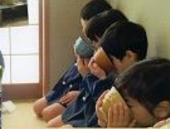
地域の方に教えてもらって のびんをいじりました (ひなまつりお茶会)