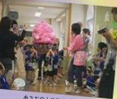
あつちの人が作ってくれた ワッショイ・ワッショイ (中之町まつり)