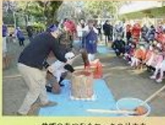
地域の方に片もろちの仕事を 教えてもらいました