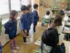
絵本で作って来てくれてありがとうごさいます (赤坂中学校)