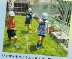
ジャガイモたくさんとれたね、数えてみよう