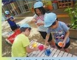
色水づくり、あっ色がかわった