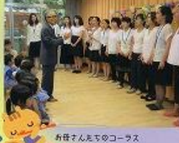
お母さんたちのコーラス 素敵だね