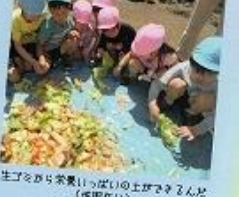
主ごから言葉いっばいの上げさるんだ (撮影有り)