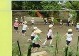
たくさん走ると気持ちがいいね