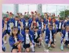
赤坂中学校の校長が運動会 区いね園を見学していいね