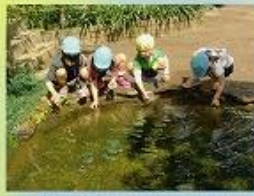
おたまりやくし、何ましているんだらう