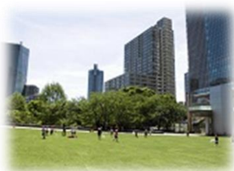
ミッドタウンの芝生も解禁。気持ちいい～！