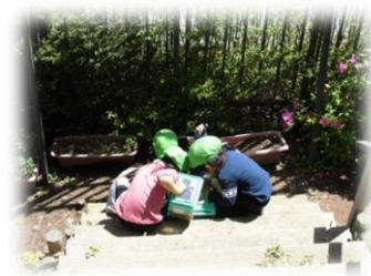
段々畑は、発見の宝庫です