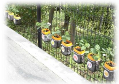
枝豆、うまく育ちますように！

心地よい気候です。たくさん体を動かしながら遊べるように、工夫していきたいと思います。