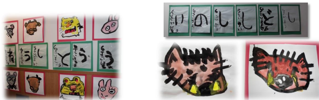
十二支の絵と文字が飾られました。 年長 宇宙組幼児の作品です。