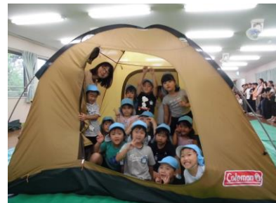
年長組 キャンプごっこ