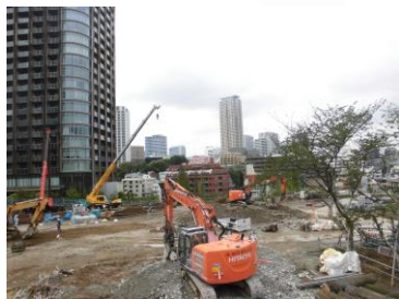
2階から見える景色が様変わりです。