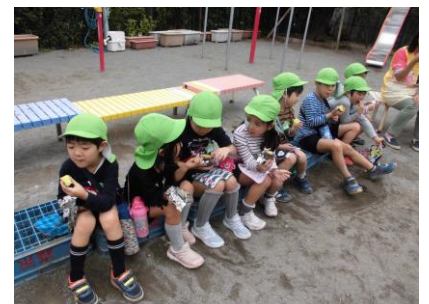
様々な秋を楽しんでいます。