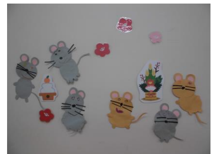
令和2年はねずみ年でチュ〜