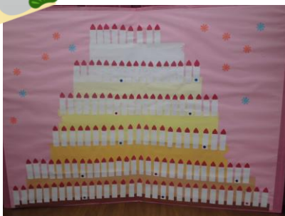
幼稚園は129歳になりました