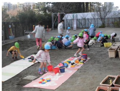
年末のおおそうじ！