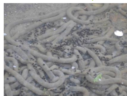
いつうまれるかな?