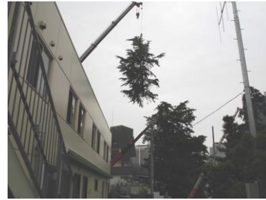
正門横の中学校のイチョウの大木がなくなりました