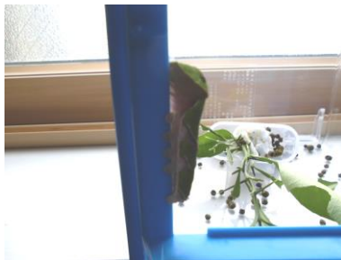
幼虫も大きく生長！