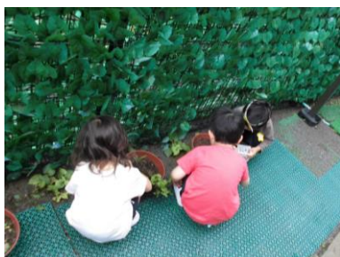
ダンゴムシみ〜つけた！