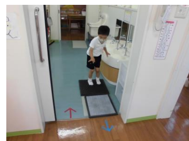
トイレから出る時は靴底をトントンと消毒です