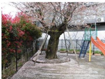
さくらちゃんの花びらが散り、雪が積もったようです。