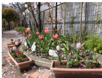
子どもたちが植えた球根。花ざかりです！