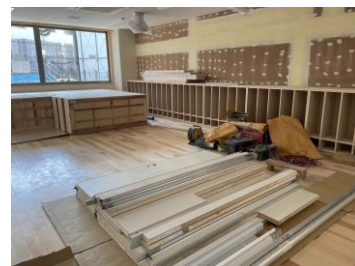
工事中的新園舎。ここは1階保育室。今の保育室より広～いです!!