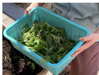
太陽組が育てたホウレンソウ。おみそ汁にして食べました。