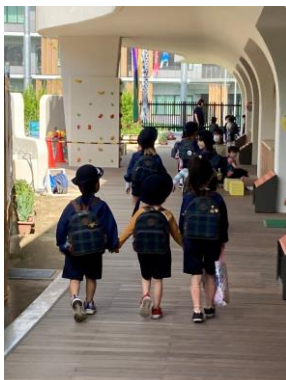
宇宙組さんお迎えタクシーありがとうございます！ 水筒を出したり、上靴を履かせたり、たくさんお世話をしてくれています。

PTA 総会も無事終え、PTA 活動も本格的に始動し始めました。新たな役員のみなさまを中心に、時代や実態に即した、誰もが参加したくなるようなPTA 活動となることを期待します。