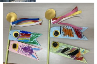
各学年のこいのぼり 太陽組はシールを貼ってうろこにしました。地球組は目、吹き流しは糊を使い、模様はクレパスで描きました。宇宙組は、3、4人のグループで色やしっぽの形、模様を相談しての共同作品です。