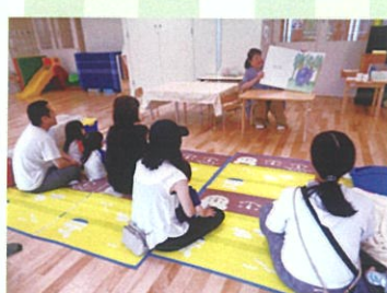
未就園児の会「ひよこクラブ」