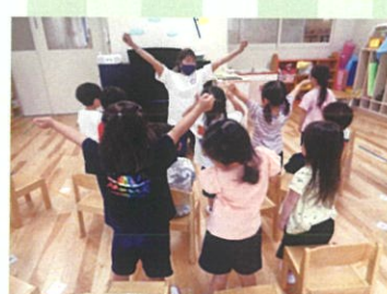
N.Tの先生と「英語で遊ぼう」