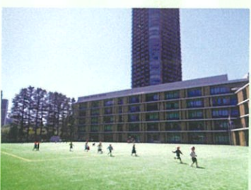
赤坂学園校庭で鬼遊び