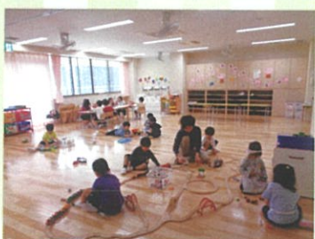
子育てサポート保育「さくらちゃんクラブ」