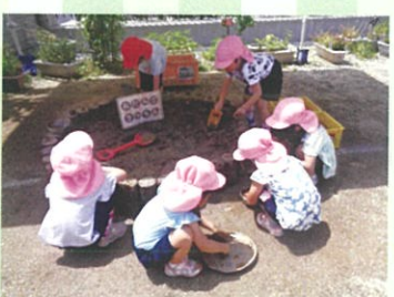
おだんごキッチンで泥団子づくり