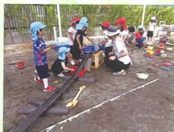
砂場で水を使った遊び